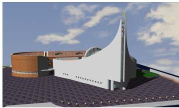
COMUNITA' PARROCCHIALE DI BONDANELLO